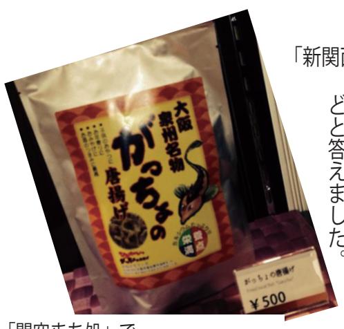
「関空まち処」で大阪 泉州名物として販売しているスナック菓子「がっちょの唐揚げ」