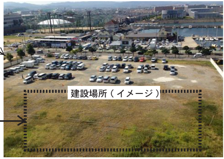
建設場所（イメージ）

9月28日（日）午前10時 府営住宅2棟上階から、真横の府分譲地、漁港方向を撮影