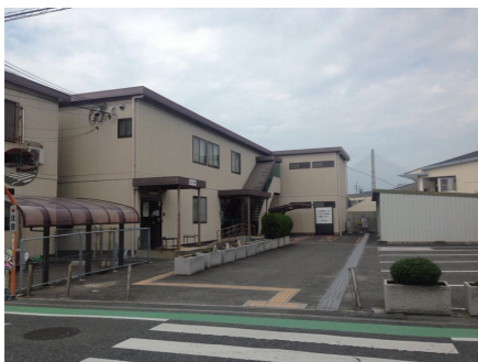
なかよし学級（学童保育）施設