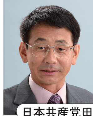
日本共産党田尻町会議員団