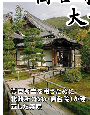
豊臣秀吉を引うために北政所(ねね・高台院)が建立した寺院