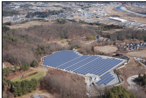
飯田市と中部電力が提携して完成した太陽光発電所「メガソーラーいいだ」今年、1月末に運転開始