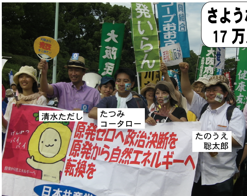
日本共産党大阪府委員会の隊列の先頭

再稼働反対！琵琶湖を守ろう！子どもを守ろう！ 私たち近畿は、新宿コース2.7キロをデモ行進しました