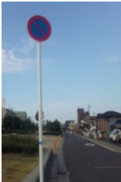
設置された駐車禁止の標識

私は、5回にわたり一般質問でとりあげ、府警とも交渉を行い、「保管法」にもとづく規制を実施させてきました。また、昨年1月には、付近住民が駐車禁止を求める陳情署名を提出など、住民の皆さんとご一緒に実現できました。